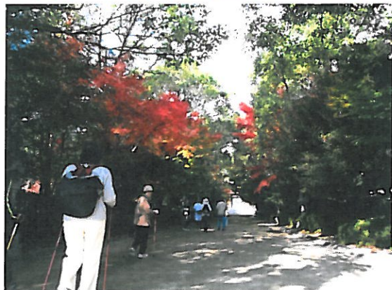
速谷神社の紅葉トンネル