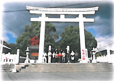
ご参加 ありがとうございました。