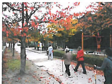
峰高公園内もキレイでしたよ

今回は ☆道(平坦・傾斜・段差)に合った ポールの高さと地面に着く位置 ☆背骨のカーブと姿勢 ☆靴の選び方 ☆運動前後のストレッチの違い などのお話もさせていただきました。