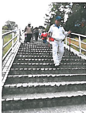
階段もポールがあれば 膝への負担が軽減します。